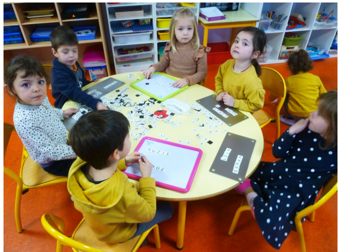
Les Moyennes sections écrivent leur prénom et ceux des autres enfants de leur groupe avec des lettres mobiles. On commence à apprendre à nommer et identifier de plus en plus de lettres. Ils ont aussi tapé leur prénom à l'ordinateur, pas facile...

Quand arrive le temps de Noël Aux mille merveilles, aux milles bonheurs Je fredonne à Dieu comme les anges Les mille louanges que j'ai dans le coeur. Pour les rues qui scintillent, le sapin décoré, Pour la fête en famille, les cadeaux échangés, Louange à Dieu ! Pour les gestes d'entraide, les mots d'amitié, Pour la joie du partage, la joie de donner, Louange à Dieu ! Pour la crèche où Jésus est venu parmi nous, Pour Joseph et Marie, devant lui à genoux, Louange à Dieu !